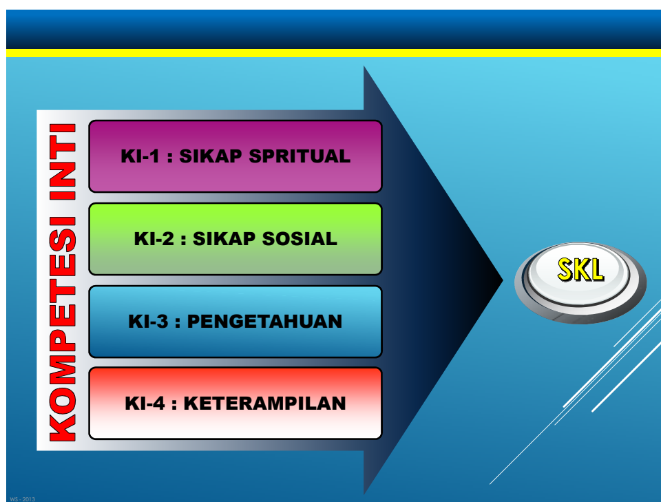
Bagan 3. Struktur Kompetensi Inti